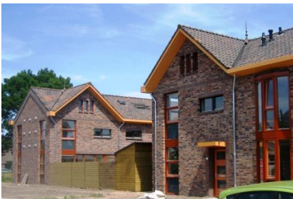
23 WONINGEN GILZE