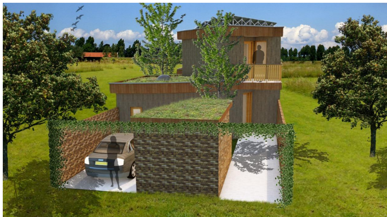
3D impressie, sfeerbeeld