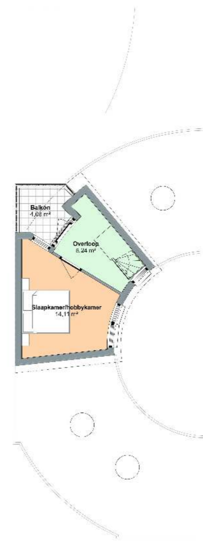
Optie 1e verdieping