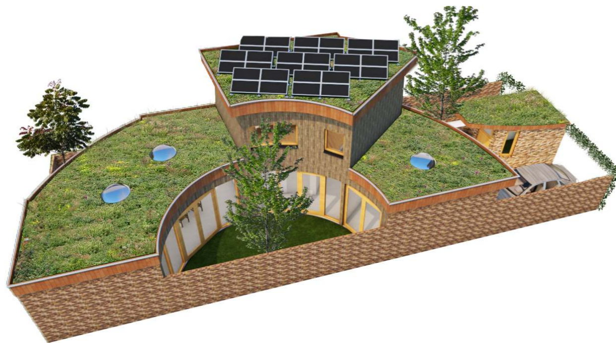
3D impressie, sfeerbeeld

ALPHENSEWEG 65 5126 AB GILZE T 0161-451021 F 0161-451022 EMAIL: INFO@VANLAARHOVENCOMBINATIE.NL SITE: WWW.VANLAARHOVENCOMBINATIE.NL