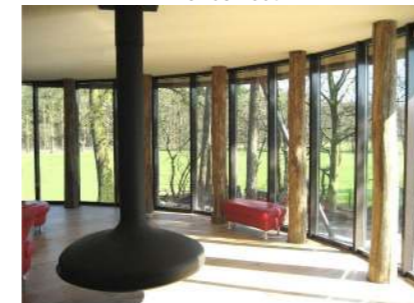
Ruwe boomstammen, sfeer impressie